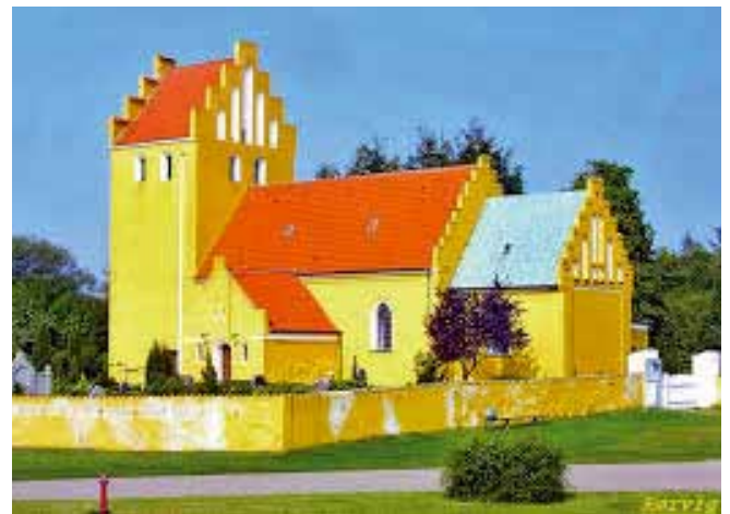
Årets pilgrimstur går til Rørvig Kirke.

Lørdag d. 3. juli byder Nykøbing kirke igen i år en vandretur i forbindelse med Geoparkfestivalen, der i år har 'Kunst' som tema. Vi indleder turen med en andagt i Nykøbing kirke kl. 15.00, og begiver os herfra ud på en ca. 11 km. lang strækning gennem naturen med det særlige landskab og lys, der har tiltrukket adskillige kunstnere gennem tiden. Vi modtages et par timer senere i Rørvig kirke med en andagt i kirken og et let måltid mad i sognehuset. Angående tilmelding og billetter: Se hjemmeside og Geoparkkatalog.