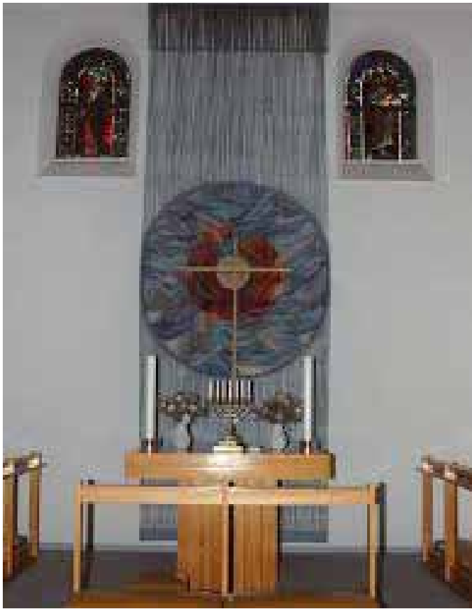
Alterpartiet i Lumsås Kirke

Temaet for årets Geoparkfestival er ”kunst” og derfor skal denne gudstjeneste handle om kunsten i Lumsås Kirke. Gudstjenesten vil tage os med på en vandring igennem kirkens kunstværker; en vandring som fører os fra Skabelsen over Jesu lidelse og frem til fuldendelsen i Paradis. På den måde prøver vi at se kirkens kunstværker i et nyt lys – som luger ind til en anden verden.