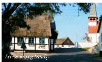
Reersø Kro og Landsy

Betaling foregår i bussen, mobilepay eller kontant.